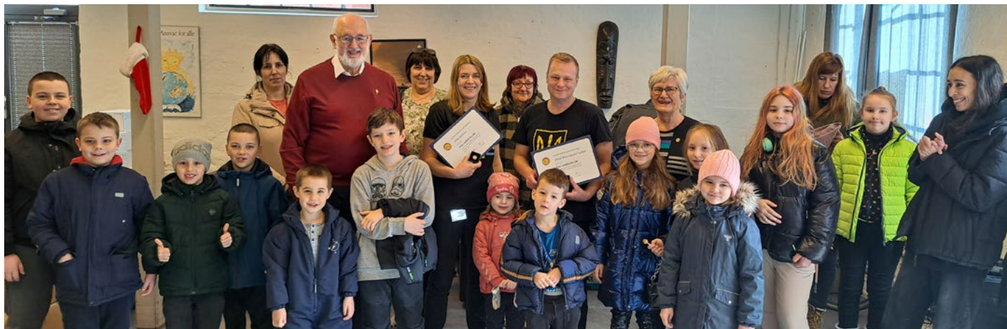
Flere beboere overværede udnævnelsen i Dragonparken.